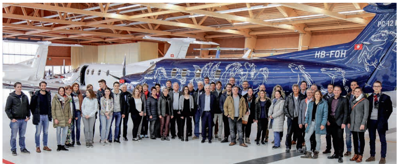
Jubiläumsausflug 30 Jahre Neutrass-Residenz AG: Die Belegschaft zu Gast bei den Pilatus Flugzeugwerke AG.

Die Pilatus Flugzeugwerke AG mit Hauptsitz in Stans ist nach ISO 14001 zertifiziert und zeigt ein hohes Umweltbewusstsein. Drei selbstständige Tochtergesellschaften in Broomfield (Colorado, USA), Adelaide (Australien) und East Sale (Australien) gehören zur Pilatus Gruppe. Mit über 2000 Mitarbeitenden am Hauptsitz ist Pilatus einer der grössten Arbeitgeber in der Zentralschweiz. Pilatus bildet rund 130 Lernende in 13 verschiedenen Lehrberufen aus – die Förderung von jungen Berufsleuten hat bei Pilatus einen hohen Stellenwert.