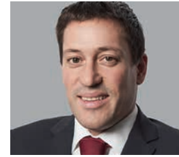
Candid Wild International/Spezialprojekte Telefon 041 799 80 40